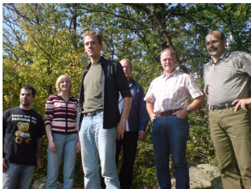
Visionär: Die Dokoleitung. Nicht im Bild: Markus. Und Suz, die war wattwandern.

Am ersten Oktoberwochenende begab sich die Doko-Leitung in Klausur nach Hohenstein, um einen Rückblick auf die letzten Jahre der Arbeit zu machen.