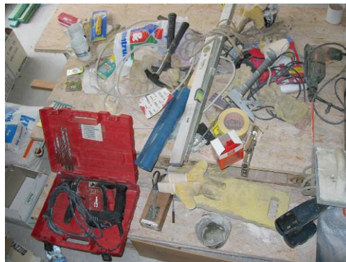
Wieviele Werkzeuge sind hier abgebildet?

Unlängst rechnete Peter mal nach und kam auf die beeindruckende Zahl 3392 . Nein, es geht hier nicht um Geld. Es geht um Zeit. Insgesamt 3392 Stunden haben wir seit dem Bausommer 2003 am, um und für den Donnerskopf gearbeitet. Ehrenamtlich und unentgeltlich. Und dabei sind die Tage vor Silvester, der Bausommer 2005 und das Jahr 2004 nicht mitgerechnet. Was das heißt, kann man nicht schreiben. Nur angucken. Es ist beeindruckend. Chapeau.